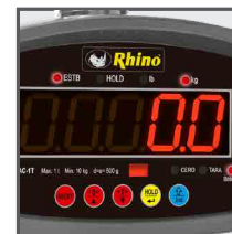
Pantalla con iluminación LED