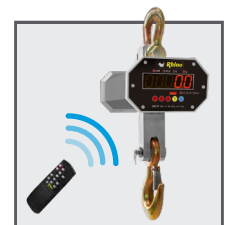
Opción de operación a distancia por control remoto

SERVICIO Y REFACCIONES DISPONIBLES Contamos con una red de centros de servicio en toda la república: rhino.mx/servicio.html