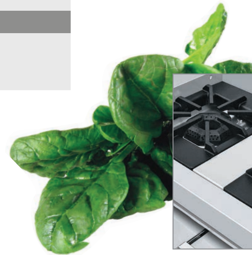
Robustas parrillas súper resistentes.