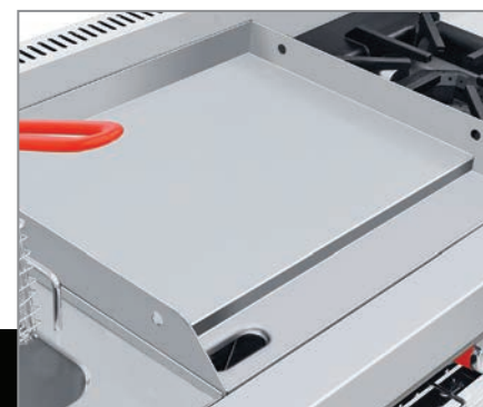
Plancha con exclusivo sistema recolector de grasa y residuos.