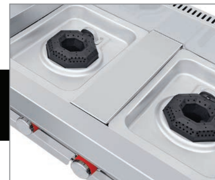
Cubierta semi-sellada para evitar derrames al interior.

Disponibles en tres diferentes versiones: