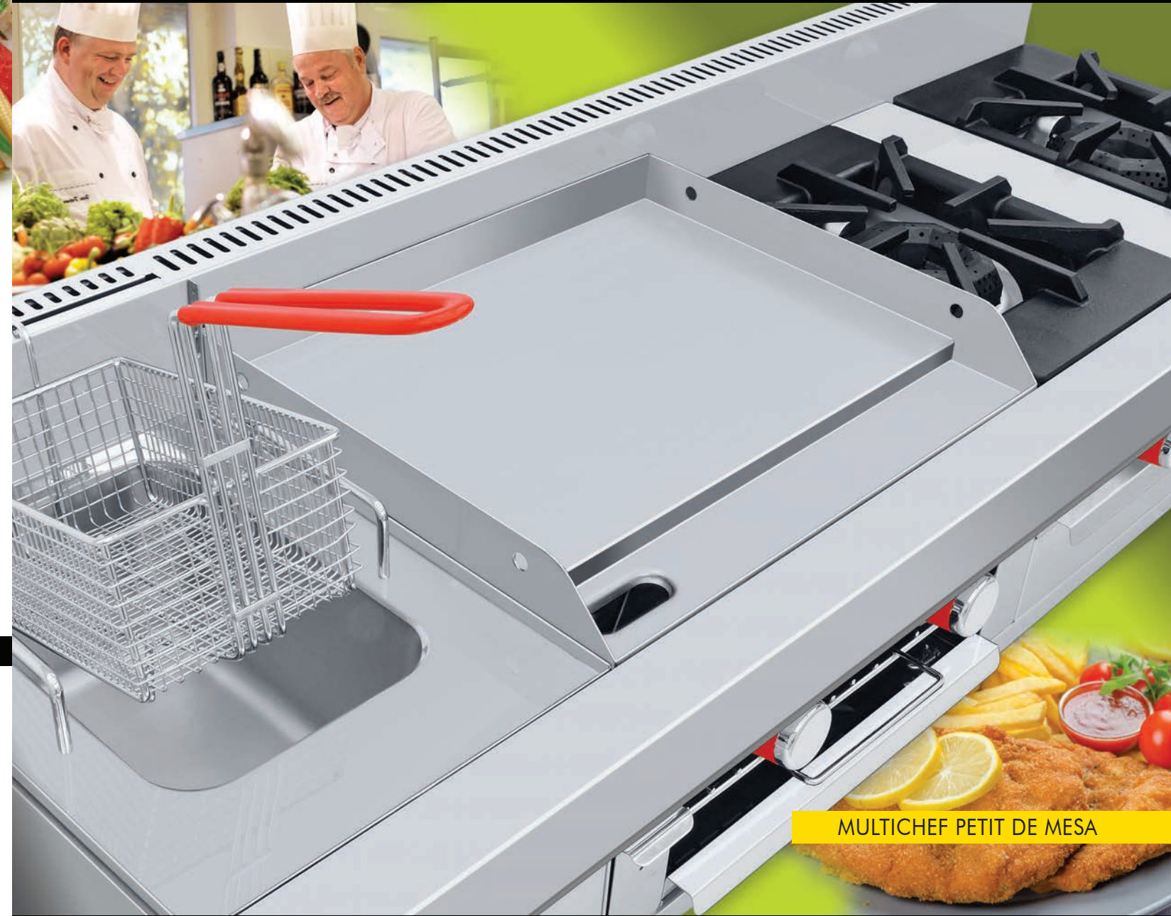
MULTICHEF PETIT DE MESA