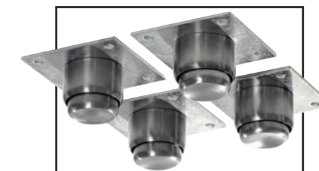
OPCIONAL: Base estructural o Kit de patas tubulares.

Disponible en tres diferentes versiones: