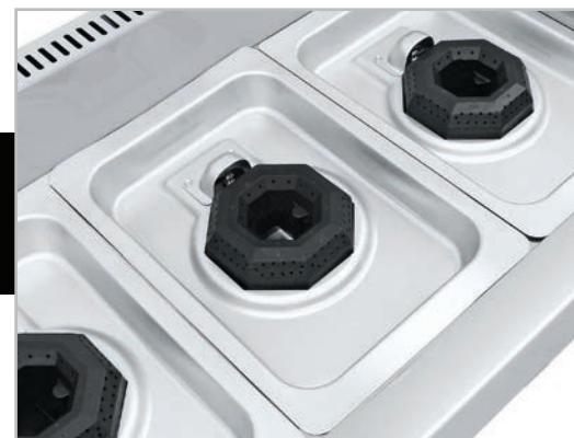
Cubierta semi-sellada que evita derrames al interior.