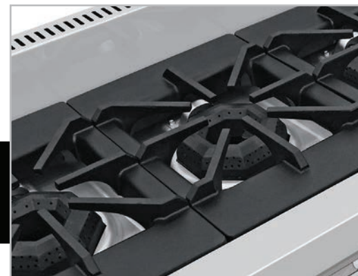
Robustas parrillas súper resistentes desmontables.