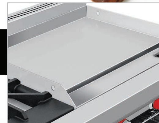
Plancha con exclusivo sistema recolector de grasa y residuos.