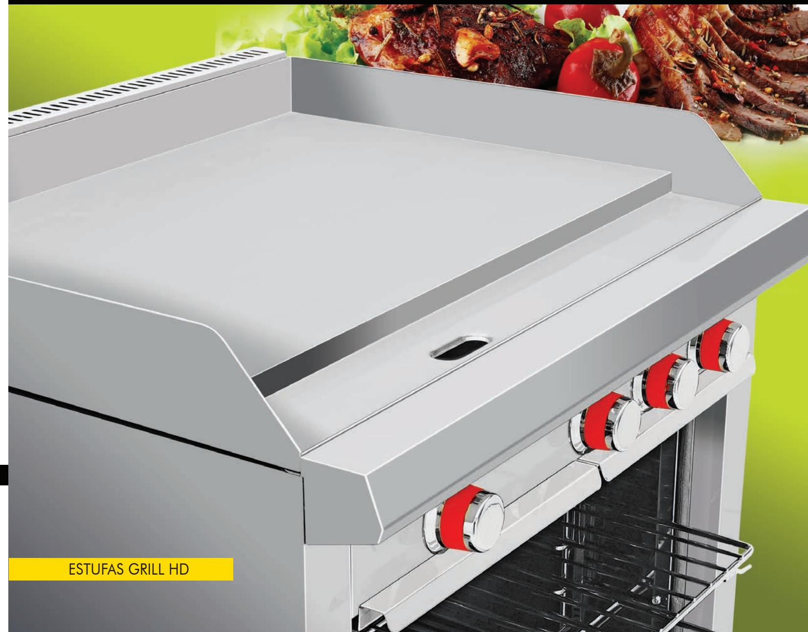
ESTUFAS GRILL HD