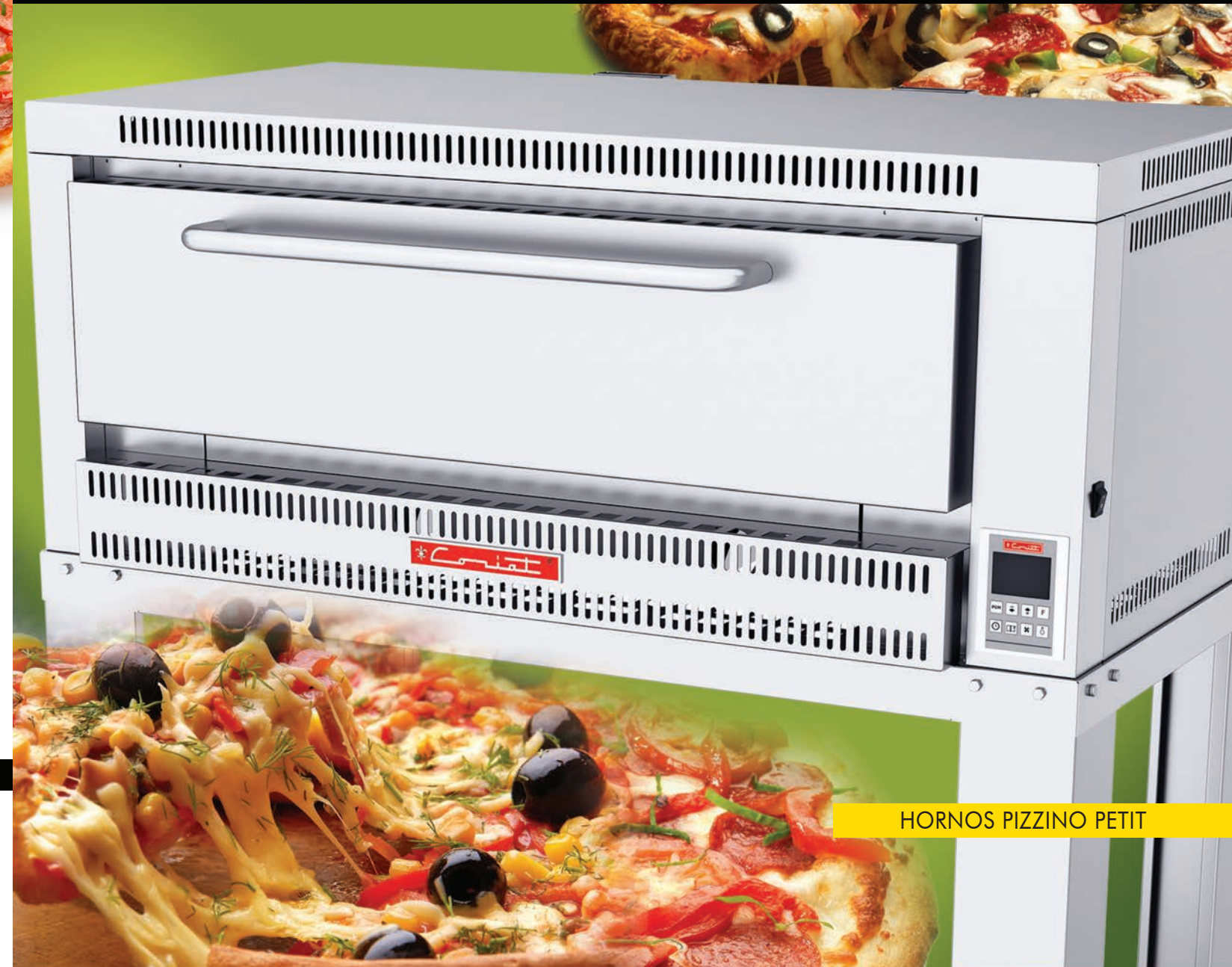
HORNOS PIZZINO PETIT