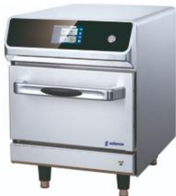
Cocción y Hornos - Horno de alta velocidad - Chef-N-Go!